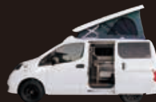
UTONE 200 field base