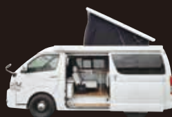
UTONE 500 field base

過ごし方、楽しみ方は人それぞれ。 そのための拠点となり、過ごす、寝る居場所(基地)となります。 「ウゴク・トドマル・ネル」から「う・と・ね」と名付けました。