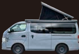
UTONE 300 field base