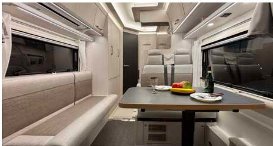
リバティ 52RE iダイネット