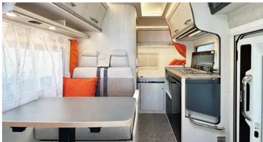
リバティ 52SP iダイネット