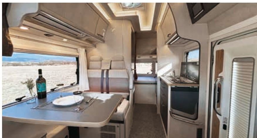
リバティ 52DB iダイネット