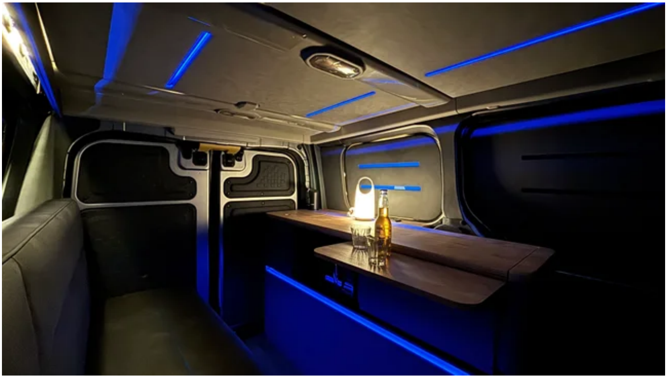
「LAC EV CAMPER C（プロトタイプ）」