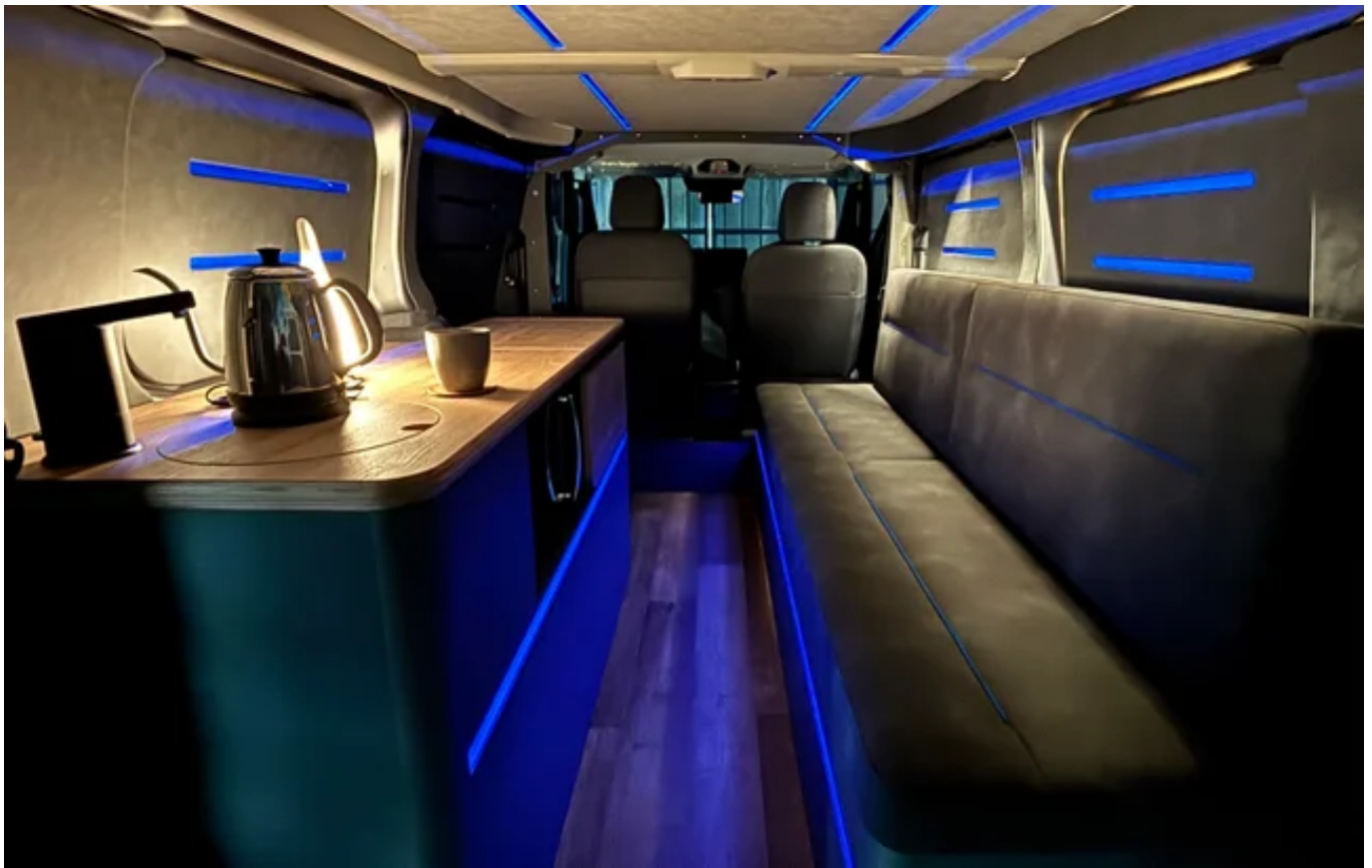
「LAC EV CAMPER C（プロトタイプ）」内装