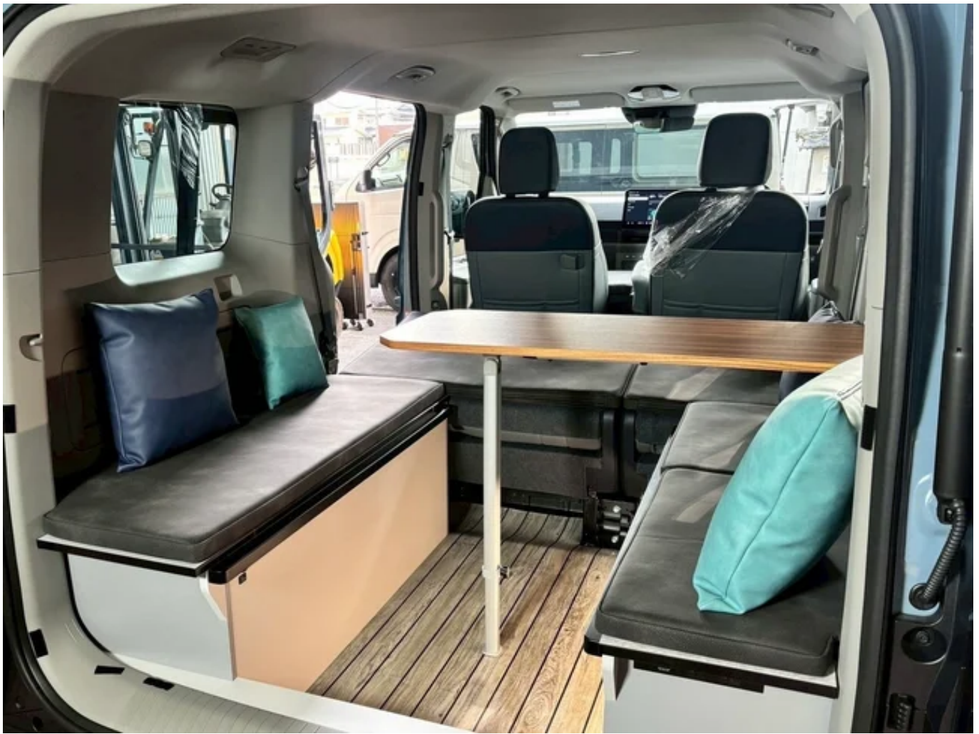
「LAC EV CAMPER P」