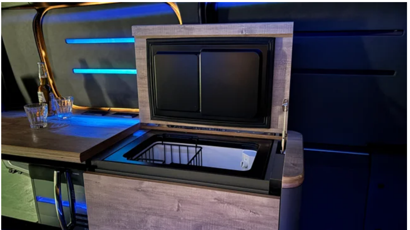
「LAC EV CAMPER C（プロトタイプ）」