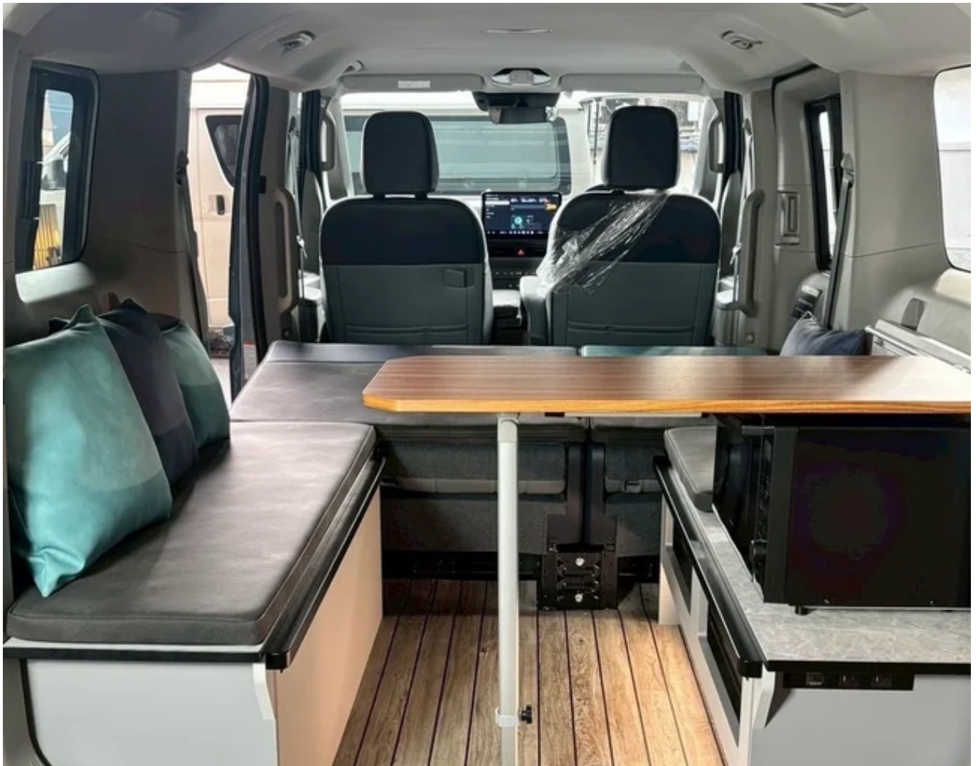
「LAC EV CAMPER P」 内装