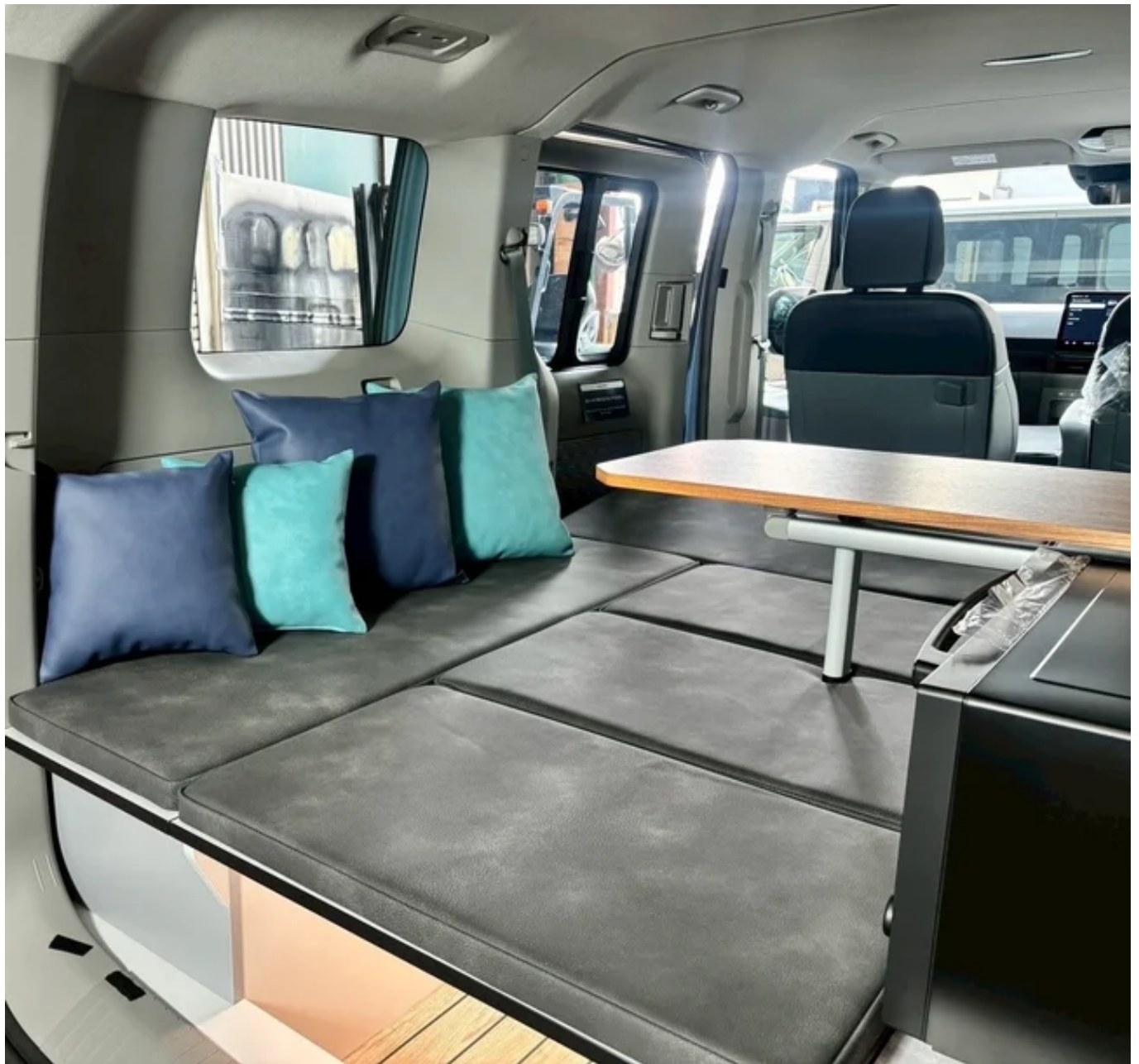
「LAC EV CAMPER P」

インテリアには最大1500W対応のコンセントを備え、さらに車外へ電力を供給できる1500Wの外部給電システムも搭載。車内外を問わず、家庭用電源と同じ感覚で電気を使用できます。