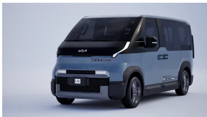
キア PV5 パASSEンジャーベース「LAC EV CAMPER P」