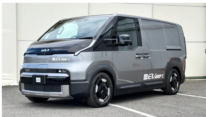
キア PV5 カーゴベース「LAC EV CAMPER C（プロトタイプ）」