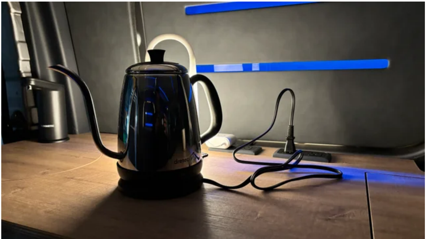
「LAC EV CAMPER C（プロトタイプ）」